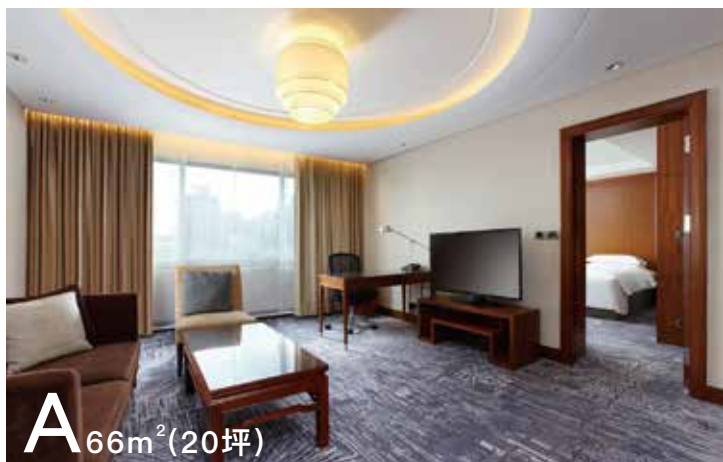
A 66m 2 (20坪)