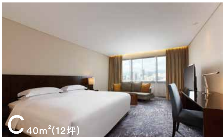
C 40m 2 (12坪)