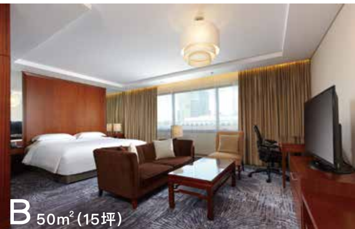
B 50m 2 (15坪)